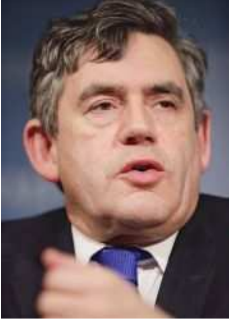
श्री. गोर्डन ब्राऊन (सध्याचे पंतप्रधान, लेबर पार्टी, वय: ५९)