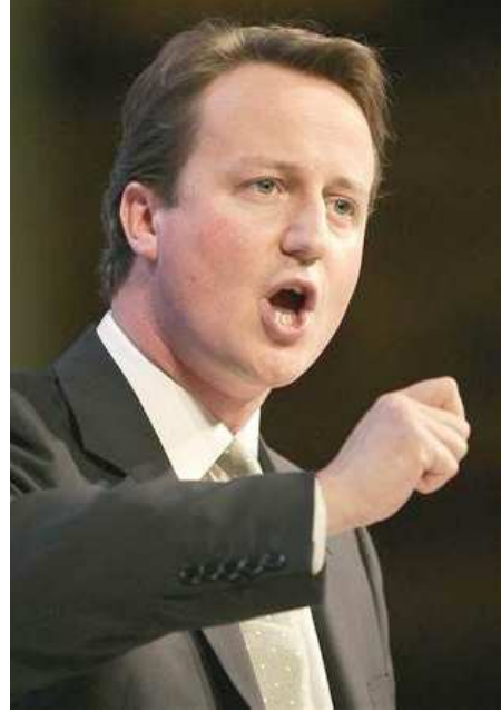
श्री. डेविड कॅमरॉन उमेदवार: पंतप्रधान, कन्सर्वेटिव पार्टी, वय: ४३)