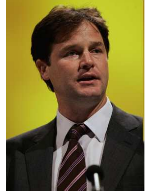
श्री. निक क्लेग (उमेदवार: पंतप्रधान, लिवरल डेमोक्रेट्स, वय: ४२)